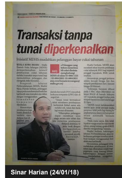
Sinar Harian (24/01/18)